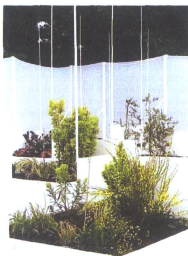
« Couleur captive » : un jardin tout blanc, où seules les taches de végétaux de couleur ressortent.